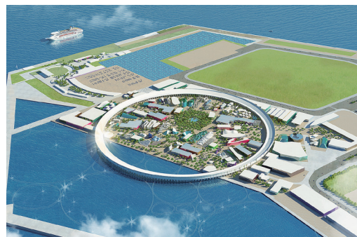
大阪・関西万博会場イメージ図

工事名称：2025年日本国際博覧会施設整備事業PW西工区建設工事 施工会社：竹中工務店・南海辰村建設・竹中土木共同企業体・株式会社昭和設計 採用商品名称：軽量盛土材「エスレンブロック」「エスレンブロック RNW」 使用数量：約838m 3 納入時期：2023年5～9月(予定)（「エスレンブロック RNW」の納入は9月予定） 採用目的：軟弱地盤における建築物の沈下対策